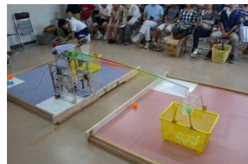
昨年度の予選競技会

【表彰ほか】 上位入賞者を表彰します。上位入賞者2名には、和歌山県御坊市で行われる全日本小中学生ロボット選手権決勝戦に参加していただきます。決勝戦でもっとも優れたアイデアのロボットには文部科学大臣賞が贈られます。