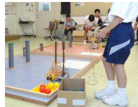
昨年度の予選競技会

【表彰ほか】 上位入賞者を表彰します。上位入賞者2名には、和歌山県御坊市で行われる全日本小中学生ロボット選手権決勝戦に参加していただきます。もっとも優れたアイデアのロボットには文部科学大臣賞が贈られます。