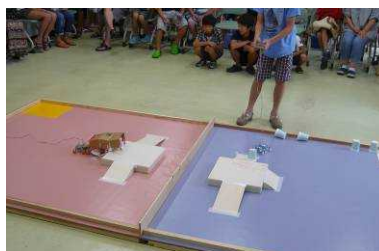
昨年度の予選競技会

【表彰ほか】 上位入賞者を表彰します。上位入賞者2名には、和歌山県御坊市で行われる全日本小中学生ロボット選手権決勝戦に参加していただきます。もっとも優れたアイデアのロボットには文部科学大臣賞が贈られます。