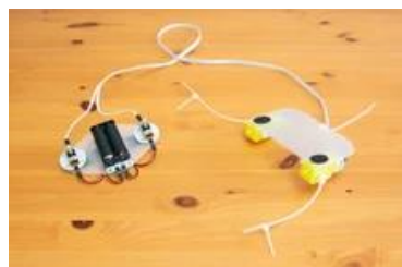
今年度使用するロボット「ユカイな生きものロボットキット」 https://kurikit.ux-xu.com/robotkit/