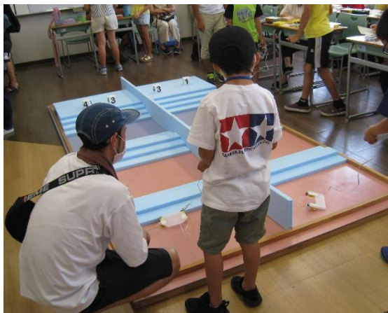
写真は昨年の講習会の様子です。