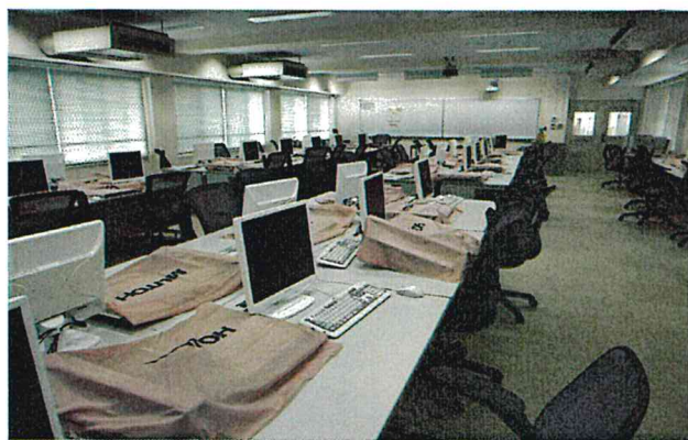
図3 機械デザインラボ

最後に、卒業生の方には高専祭、高専大会応援、技術相談、リクルートでの訪問など機会がありましたら気軽に訪ねていただきますようお願いいたします。