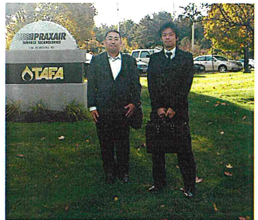
アメリカに出張した時（右側が筆者）