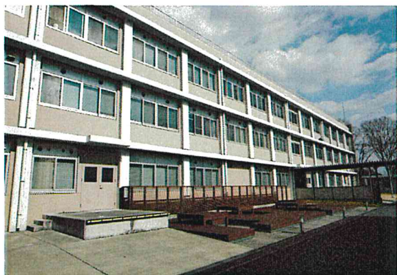
図2 機械工学科棟を南から望む

機械工学科棟は平成25年度前期に改修工事があり新しい建物に生まれ変わりました。教員室と実験室が隣り合うこれまでの配置から、コモンスペースと呼ばれる、学生が自由に使える空間内に教員室を集約する配置となりました。機械工学科棟南にはウッドデッキが設けられ、天気の良い日にはそこでお弁当を食べる学生の姿が見られます(図2)。製図室は機械デザインラボという名称になり、ひとつの机の上に手製図用のドラフターとCAD/CAE用のパソコンを置くという他高専にはない特色ある部屋となっています(図3)。