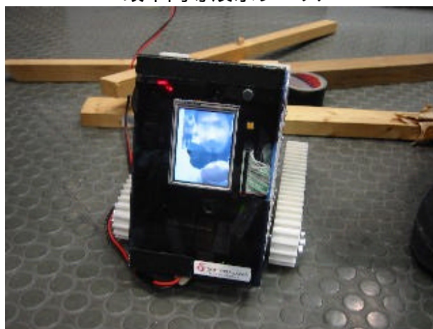
家庭用災害救助支援ロボット「ホビット」