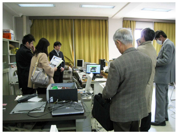
森貴彦研究室の見学