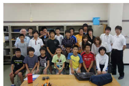
最後に集合写真を撮ります。完成したロボットは持ち帰れます。