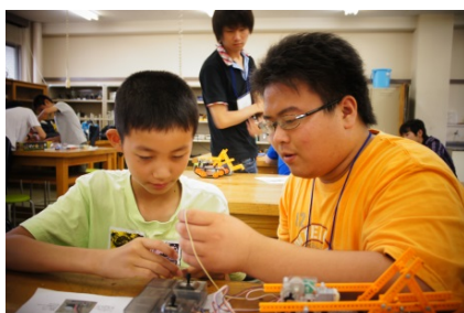
電子制御工学科の学生も頑張って、ロボットの作り方を教えます。