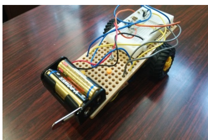
皆さんに作ってもらうライトレースロボットの一例です。