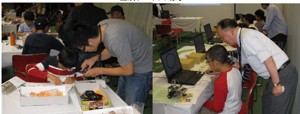
レスキューロボット工作教室の様子