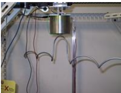
柔軟磁性体の磁気浮上搬送

本研究室では、磁気浮上技術の応用として、電磁石の磁気吸引力を制御することで、磁性体を非接触で把持・搬送するシステムの開発を進めています。本システムの特徴として、位置センサを用いることなく、電磁石の磁束と電流情報から磁性体の浮上位置を推定し、その推定値をフィードバック制御することで非接触把持を実現します。非接触での機械部品の組み立て、塗装、搬送への応用が期待できます。