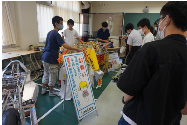
全国ロボコン出場デモ機の実演