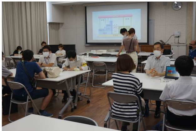
中学生および保護者の進路相談