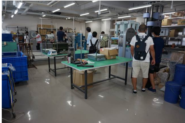
学生による構造・材料実験室の案内(建築学科)