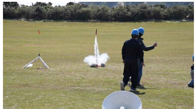
種子島ロケットコンテストの様子