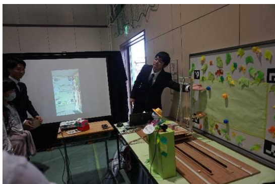
「テク農ロジー」をテーマにプレゼン発表する学生