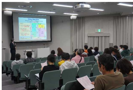
高専教育の説明を熱心に聞く参加者