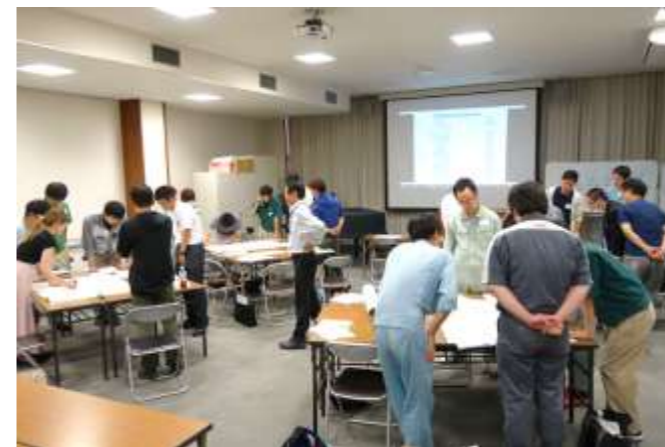
受講者参加型講座