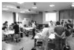
受講者参加型講座