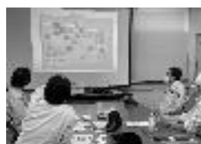
企業現場でのワークショップ

岐阜高専と地元企業等との連携を図り交流を深め地域社会の発展に寄与することを目的に活動しています