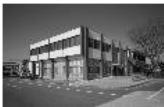
会場 図書館センター