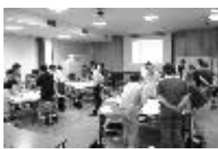
受講者参加型講座