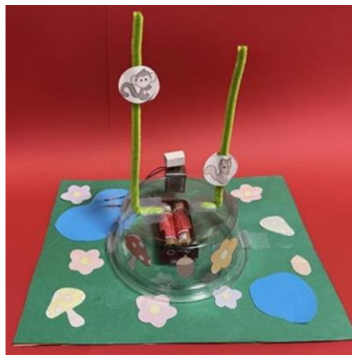
ブルブルパワー！きのぼりレース